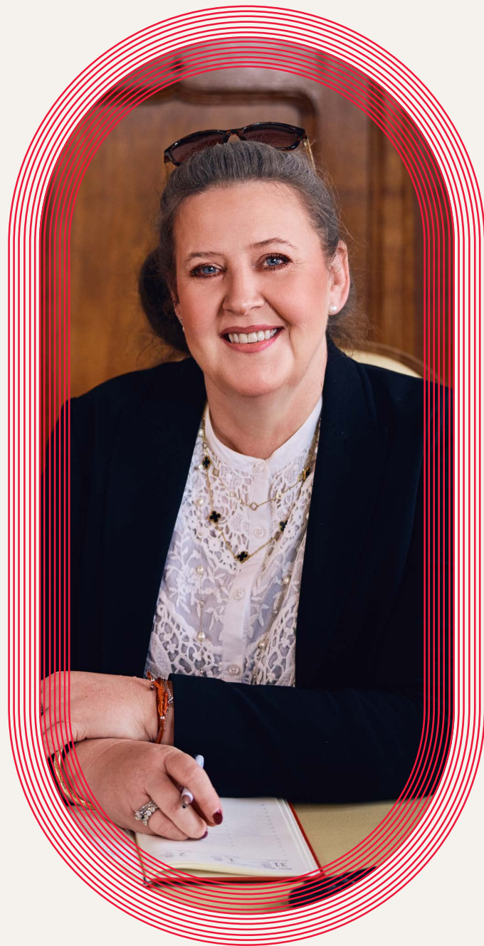
Miroslava Ferancová primátorka statutárního města Olomouc

Děkuji všem organizátorům a partnerům festivalu za jejich obětavou práci a vám, posluchačům, přeji mnoho hlubokých a nezapomenutelných hudebních zážitků.