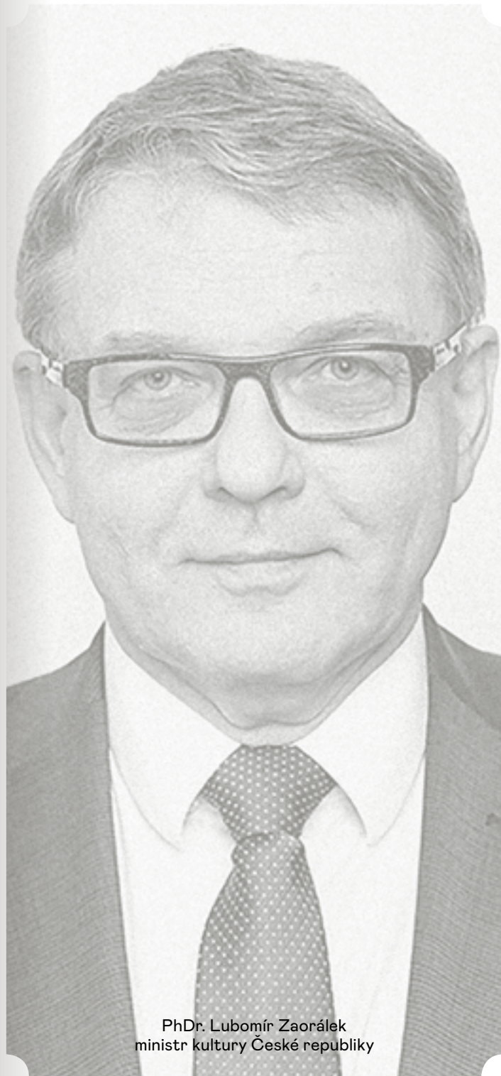
PhDr. Lubomír Zaorálek ministr kultury České republiky

Antonín Dvořák toho pro nás vykonal víc, než si ve své době uvědomoval. Těší mne, že mu každoročně splácíme dluh a vzdáváme hold způsobem, který Olomouc pasuje na jedno z kulturních center Evropy.