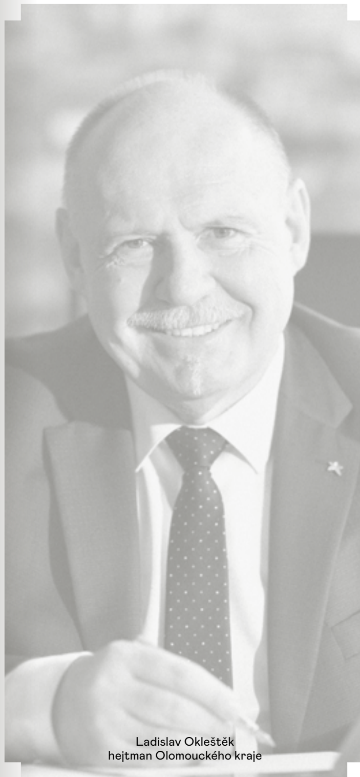
Ladislav Okleštěk hejtman Olomouckého kraje

Pokud chcete jakoukoli z těchto emocí zažít na vlastní kůži, máte letos opět šanci. Devatenáctý ročník Dvořákovy Olomouce startuje v polovině května a nabídne několik koncertů – několik šancí, které by bylo škoda promarnit.